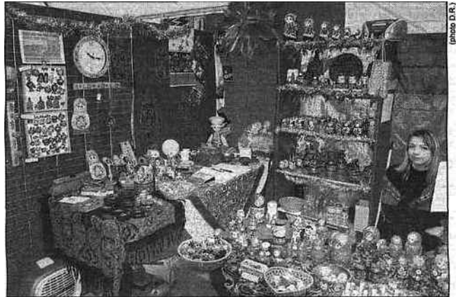
Le marché de Noël à Bayonne.

Un événement des services culturels de la ville d'Anglet en partenariat avec l'Institut culturel basque.