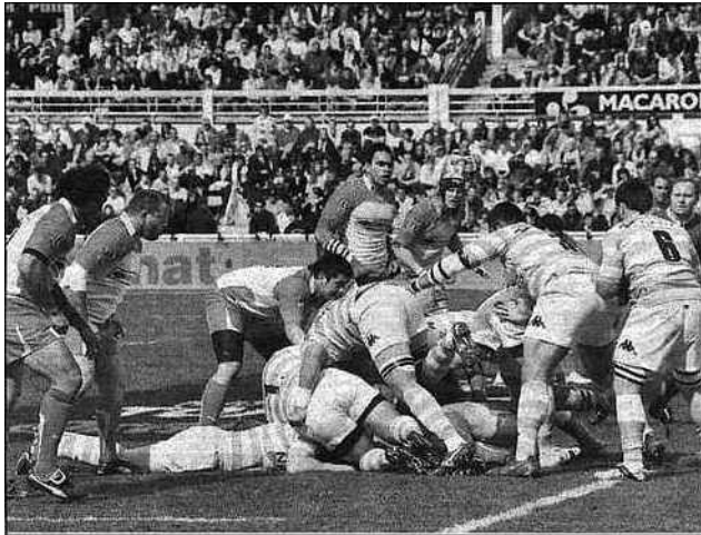
Biarritz-Métro Racing (photo archives).

Du côté de Biarritz, c'est volontairement en se privant d'une dizaine de ses cadres, ménagés avant le derby, (auxquels il faut rajouter les pensionnaires de l'infirmerie) que le BOPB est allé disputer sa rencontre au Racing Metro 92. Un déplacement à zéro point, septième défaite des Rouge et blanc (28 - 9) qui ont pourtant donné du fil à retordre aux Racingmen, menés à la mi-temps (8 - 9), ce qui démontre la qualité des jeunes joueurs titularisés une fois encore. Une nouvelle déconvenue pour les Biarrots, encaissant en seconde période vingt points en vingt minutes, et cela de la part