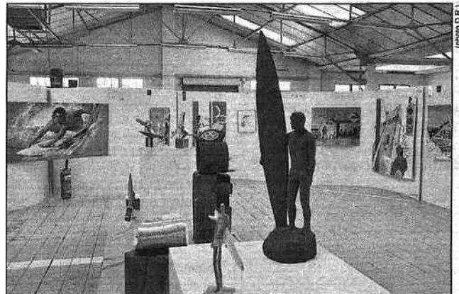
Le MIACS à Biarritz.