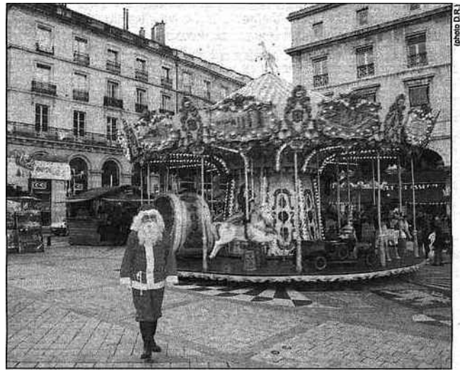
Noël à Bayonne.